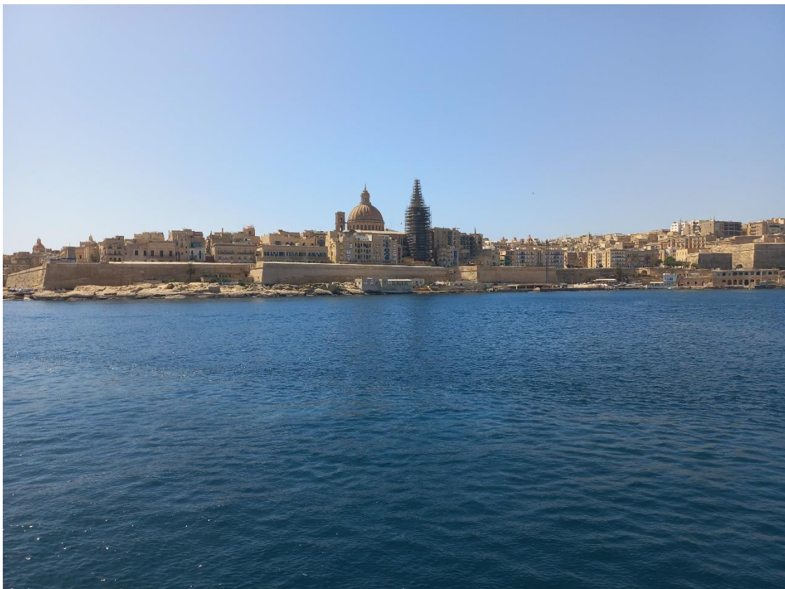
Pogled na Valletto - glavno mesto Malte